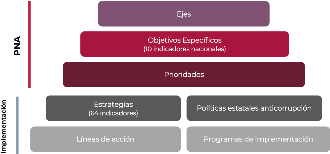
Figura 1. Sistema de indicadores del SNA