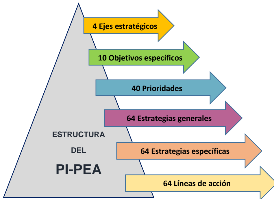
Figura 2. Estructura del Programa de Implementación de la PEA.

En este punto, es necesario definir la estructura y los criterios de la cadena lógica que se mencionan a lo largo del presente programa.