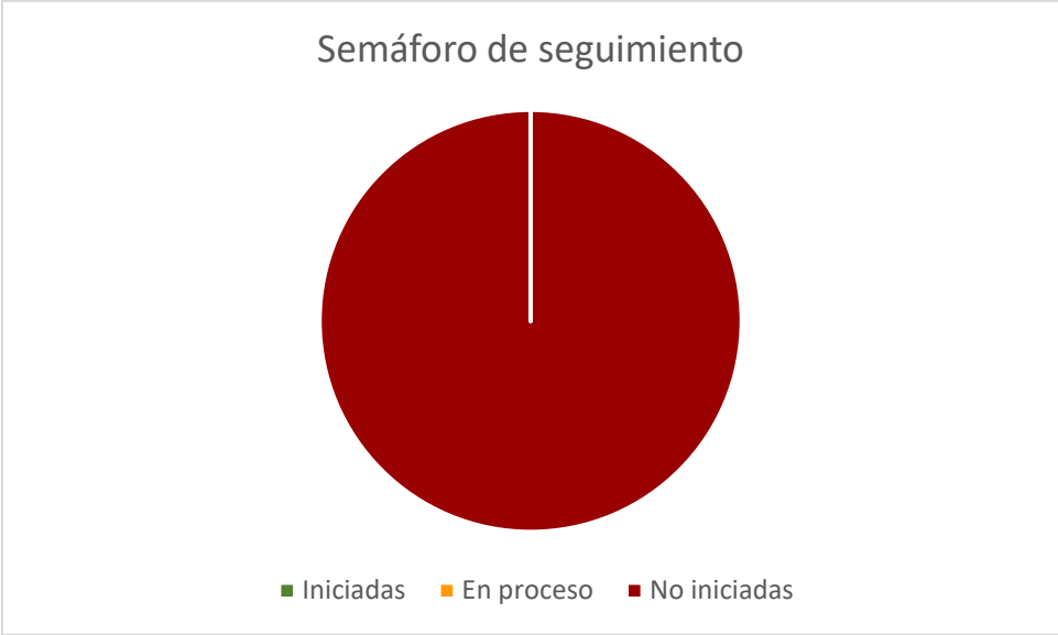
Gráfico 2. Semáforo de seguimiento.